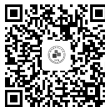
湖职院学杂费缴费二维码

(1) 学费、代管费、住宿费支付宝 APP 扫“湖职院学杂费缴费二维码”——录入新生身份证号和姓名（新生在“学号”一栏录入身份证号），点击“查询”——核对应缴金额（若不住校，住宿费金额一栏可选填 0 元），无误后点击“确认缴费”——跳转至“公共支付”界面，输入手机号，点击“下一步”——确认支付详单信息，点击“下一步”完成缴费。